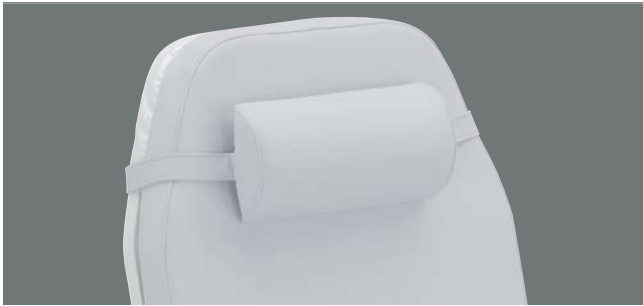
Nackenrolle zur Entspannung im Nackenbereich.