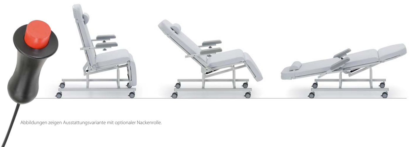
Abbildungen zeigen Ausstattungsvariante mit optionaler Nackenrolle.