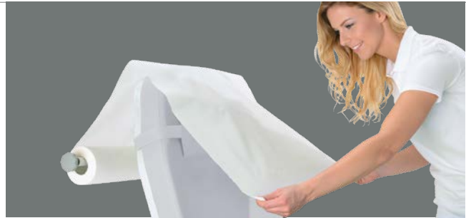
Papierrollenhalter Der fest installierte Rollenhalter hält die Papierrolle griffbereit und positioniert die Papierbahn.