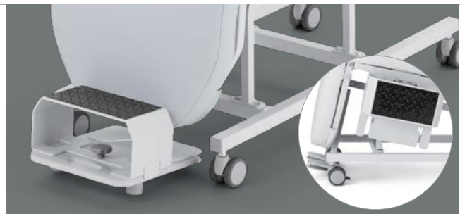
Fußstützenerhöhung mit Halterung Mehr Komfort für kleine Patienten.