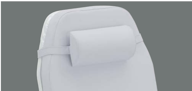
Nackenrolle zur Entspannung im Nackenbereich.