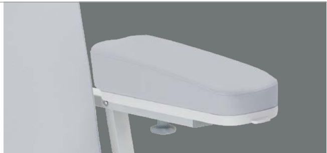
hohe keilförmige Schaumstoff-Armstützenauflagen Mit der stärker ausgeprägten Grundneigung ermöglicht diese Variante einen komfortableren Therapieverlauf.