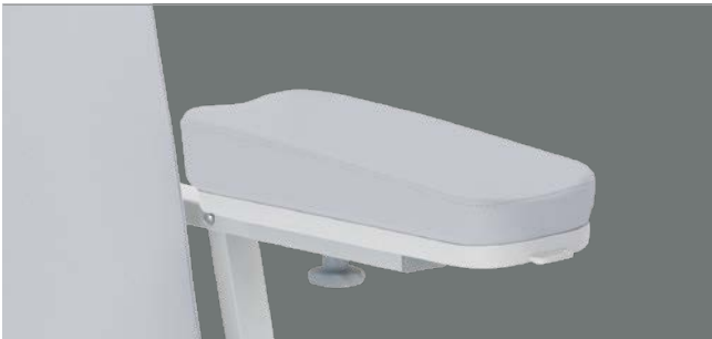
niedrige keilförmige Schaumstoff-Armstützenauflagen Ideale Option wenn Sie eine leichte Grundneigung der Armposition mit hohem Komfort benötigen.