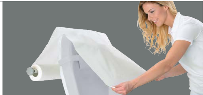
Papierrollenhalter Der fest installierte Rollenhalter hält die Papierrolle griffbereit und positioniert die Papierbahn.