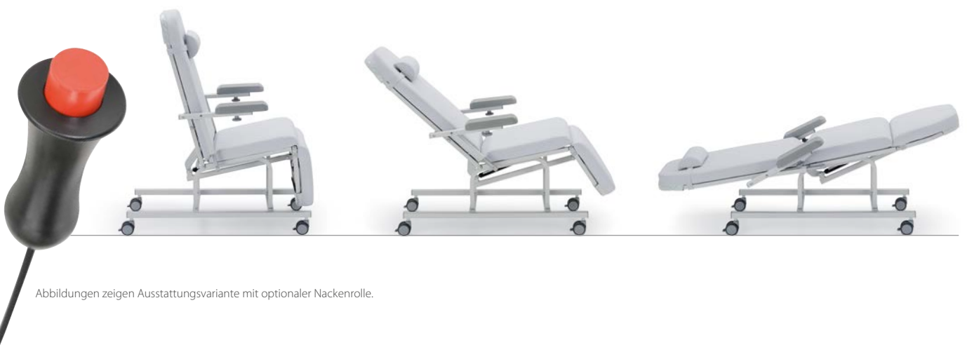
Abbildungen zeigen Ausstattungsvariante mit optionaler Nackenrolle.